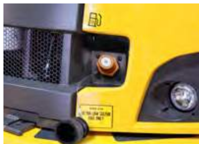
Abastecimiento de combustible rápido