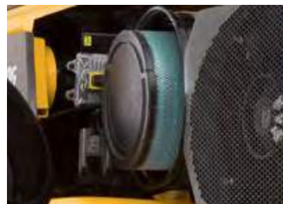
Filtro de aire de servicio pesado