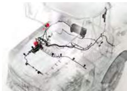
Sistema de extinción de incendios